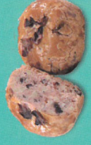
法式玫瑰芋越莓 (零糖素)

閃著紅點的餅皮，是穀類的紅寶石-紅藜，內陷選用台南東山土窯烘焙的桂圓乾，散播香氣十足，滿滿一口化作珍愛的幸福滋味。