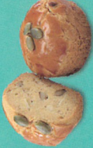
法式南瓜核桃酥 (零糖素)

精選金鑽鳳梨與海藻糖熬製的內陷，外皮加入源自南美洲的超級食物-奇亞籽，奇亞籽顆粒獨特口感以及纖維鳳梨纖維，甜而不膩，營養加分。