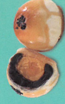
蛋黃酥 (零糖素，內含鴨蛋)

豆中之王-黑豆，與天然芥花油調製的內陷，黑豆甜而不膩，如黑曜石般散發隱晦光芒，抹茶餅皮有著清潤茶香，輕爽淡雅組合，讓人一振而笑。