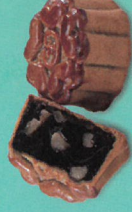
廣式栗泥核桃酥 (零糖素)

喜悠兒的幸福烘焙，以微笑溫暖你的心。每一塊餅，嚴格監控每一道製程的安全與衛生，都是取得 ISO22000/HACCP，由 SGS 認證的烘焙工場生產；2017 年中秋，喜悠兒與馬偕紀念醫院營養醫學中心，一起研發製作減少油、糖與熱量及增加纖維質，嚴選在地食材，獨家風味的禮餅，與您一起共享美味、健康與愛的佳節。