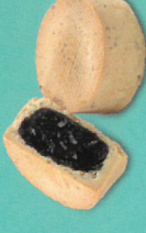
紅寶石鳳梨酥 (零糖素)

杏仁粉取代部分麵粉、芥花油代替部分奶油，鬆軟口感，搭配72%香濃巧克力內陷，浪漫甜蜜的滋味，挑逗我的味蕾。