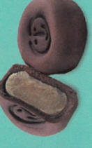
和風巧克力栗子 (零糖素)

渾身是寶的綠豆，選用芥花油調配綠豆沙，無油膩感，更添純淨清香的美味，入口難忘的傳統好味道。