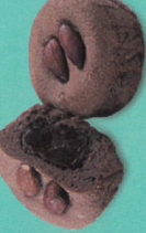
法式巧克力甜心 (零糖素)

澄黃的南瓜與杏仁粉，烘烤後飄散天然果實香氣，核桃碎粒與黃豆粉增添營養，彷彿置身田園。