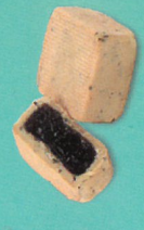
奇亞籽金鑽鳳梨酥 (零糖素)

千果之王-栗子，以芥花油調製成綿密內陷，閃耀金黃色澤；餅皮有著濃郁的巧克力芳香，醇厚的甜蜜滋味，讓人讚嘆。