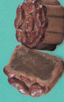
廣式蓮蓉蓮子 (零糖素)

經典廣式月餅，飽滿的栗泥陷有營養倉庫-黑栗、百果之王-紅棗及核桃，餅皮以芥花油及花生油為主，散發濃郁花生香氣，美味健康升級。