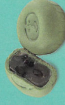
和風抹茶黑豆 (零糖素)

經典廣式月餅，內陷加上清心甜蜜的蓮子，以芥花油及花生油調配的餅皮，散發濃郁香氣，增添豐富營養與口感。